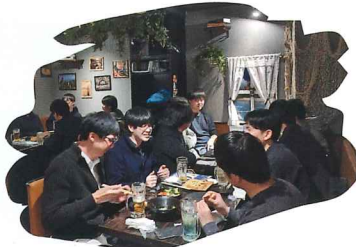
青年委員会交流会